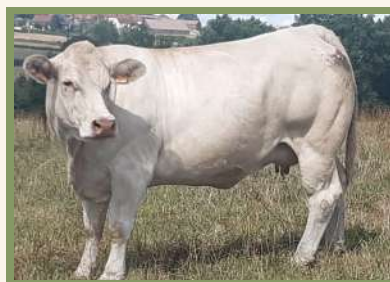
Mère de TRESOR PP