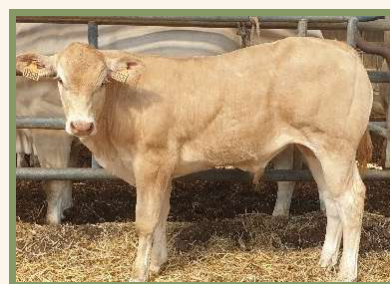
Fils de MACAO PH Pp