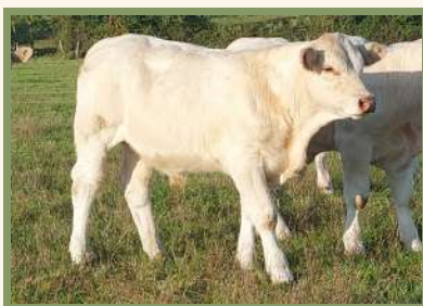
Fils de TRESOR PP