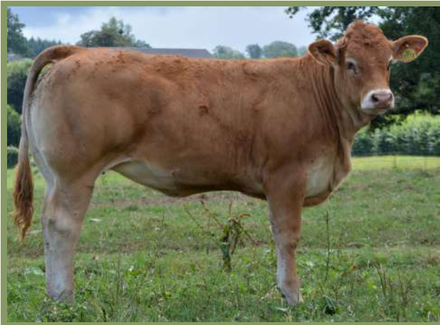
TEMPETE Pp, fille de PILOTE BEN