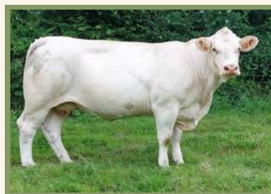
Mère UTOPIC PP