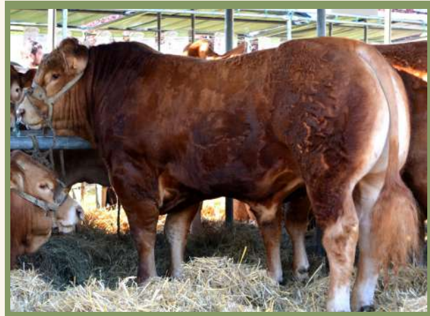
TALONNIER PP, fils de PILOTE BEN