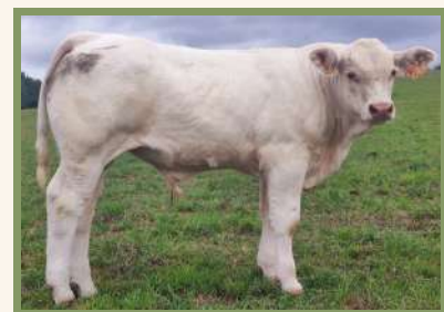
TRESOR PP jeune