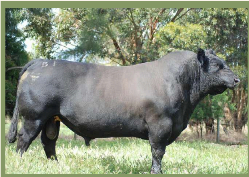
TE MANIA BERKLEY, père de VAN GOGH