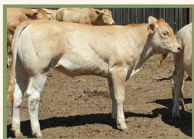
Fille de MACAO PH Pp