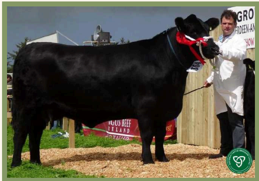
MISSIE, mère de MATTEO PP

Fils du célèbre taureau BERKLEY de l'élevage Australien TE MANIA, MATTEO est dans le top 8 des taureaux Angus en Irlande. Du vêlage très facile, de la précocité, des carcasses légères, une durée des gestation réduites de 4 jours sur la moyenne de la race