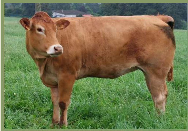
Fille de PILAF PP